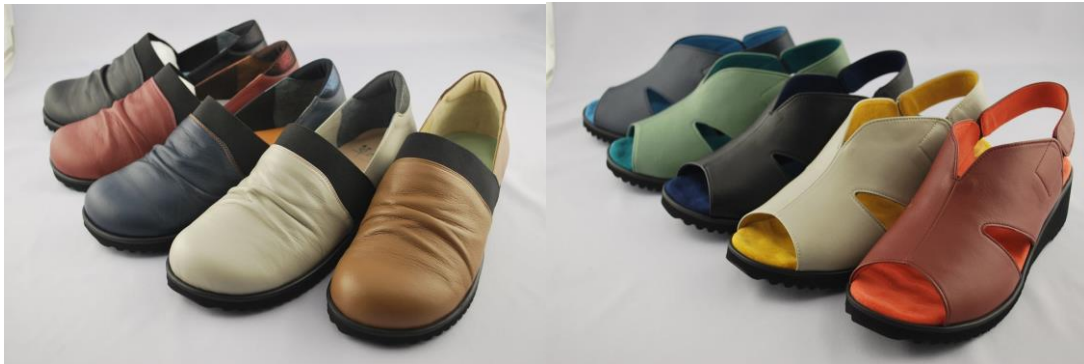
▲日本製本革『華の風 5E コンフォートシューズ』シリーズ