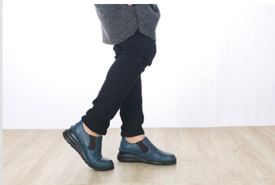
▲日本製本革『華の風 4E コンフォートシューズ』