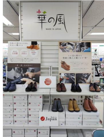
▲『華の風 東急ハンズ名古屋店』