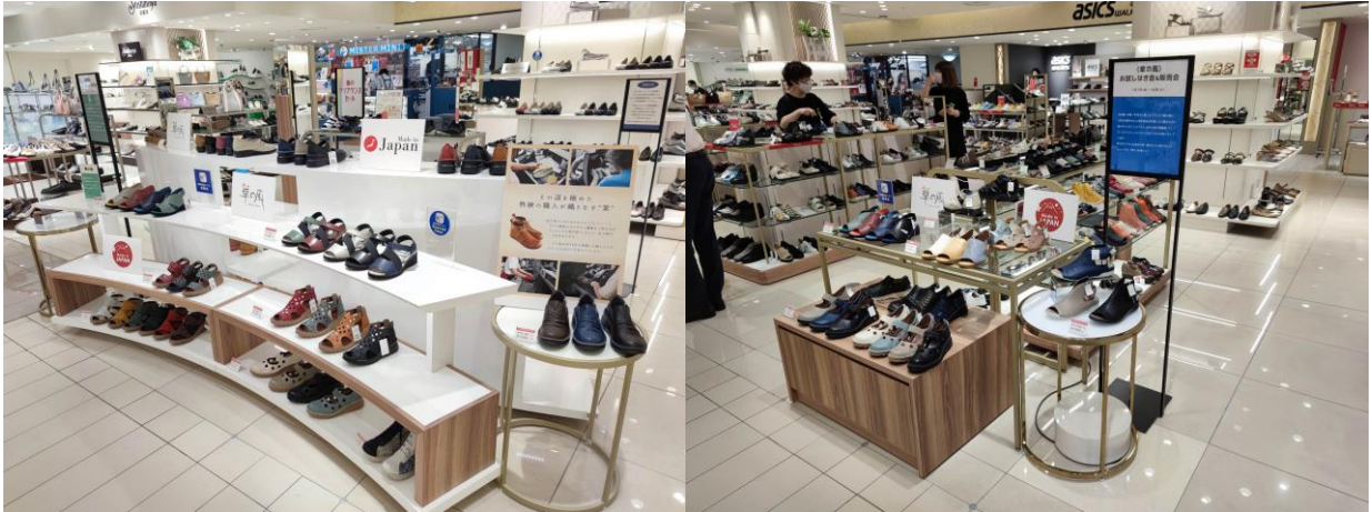
▲近鉄百貨店あべのハルカス本店での期間限定ショップ（2021年4月、7月）